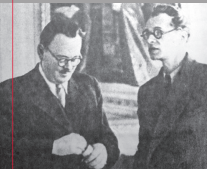
Barč-Ivan s poľským spisovateľom J. Andrzejewskim

Naše chlapčenské oči pamätajú si ho sedávajúceho v kostole na chóre, v poslednej lavici a úplne v rohu - to už ho trápila porucha rovnováhy, to už vstával až po niekoľkých pokusoch a nechcel upútať pozornosť ľudí; inokedy sedel dolu so svojou matkou, ktorá po slovensky nerozumela - on, s hlavou vždy schýlenou, s vyčnievajúcimi, neposlušnými vlasmi a ona poloslepá - sedeli započúvaní do čohosi, čomu iba oni rozumeli.